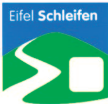
Zu den Denkmälern