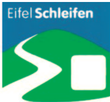
Um die Olefalsperre